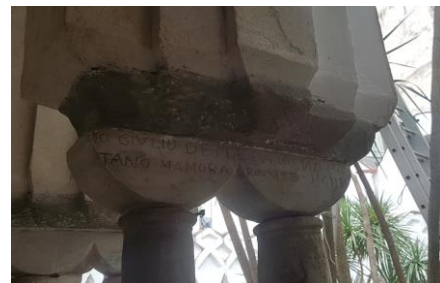
(Curtea interioara cu coloane a Catedralei din Amalfi – detalii)

1999 - Restaurarea sculpturilor din piatra si marmura din Muzeul de la Montevergine, Mercogliano (AV), pentru Soprintendenza B.A.A.A.S. din Salerno si Avellino.