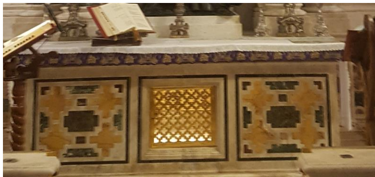
(Altarul Sf. Andrei - detaliu)

- Restaurarea altarului Sf. Andrei situat in Cripta catedralei din Amalfi - opera Arhitectului Domenico Fontana - secolul al XVII-lea - lucrare executata pentru Arhiepiscopie;