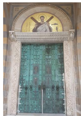
( usile Catedralei din Amalfi )

- Abatia din Goletto, restaurarea obiectelor din piatra ( basoreliefuli si statui ) provenind din manastirea din localitatea S. Angelo dei Lombardi;