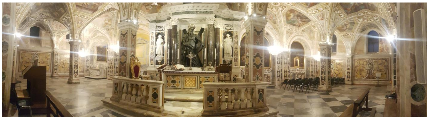
(Cripta Mormantului Sfantului Apostol Andrei - foto panoramata)

- Restaurarea placilor de marmura cu motive decorative, alcatuite din diverse tipuri de marmura colorata, care imbraca pana la o anumita inaltime peretii din cripta Sf. Andrei in Catedrala din Amalfi (SA) ;